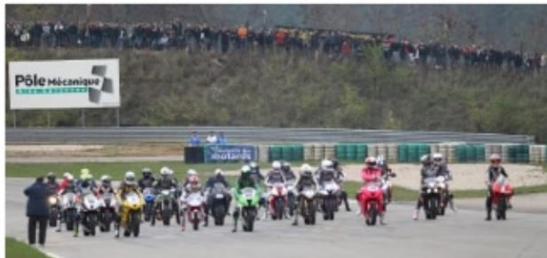
Une grille de départ qui regroupe plus de 20 titres mondiaux. Un plateau de rêve pour le public venu en masse !