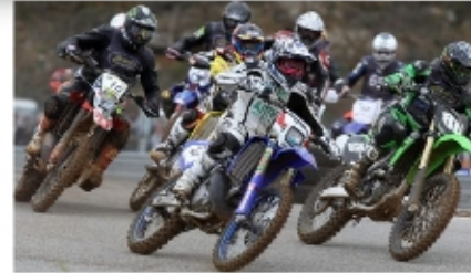
Le Supermotard, une discipline spectaculaire.

En seulement 2 éditions, le Scorpion Masters est devenu LE rendez-vous de fin de saison. L'épreuve réunit les meilleurs pilotes moto afin de concourir dans 4 disciplines: le Trial, l'Enduro, le Supermotard et la Vitesse. C'est à l'issue d'une journée de compétition intense qu'est couronné le pilote le plus polyvalent du monde : Le Master.