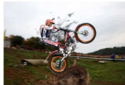
Takahisa Fujinami, champion du monde de Trial fait une démonstration de son talent.